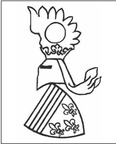
Erb rábskeho biskupa Kolomana, I. typ (1337 – 1375).

z roku 1341. Ide o vôbec prvé známe zobrazenie erbu na biskupskej pečati z nášho prostredia. 10