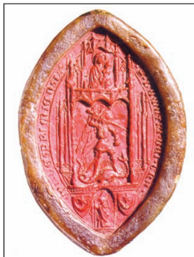
Veľká pečať vesprímskeho biskupa Demetera (1387 – 1418).

dinála Dionýza Sécího (1440 – 1465) sa uplatnil rodový erb prevýšený klobúkom. 21 Naproti tomu v jeho prsteňovej pečati sa nachádza len jeho erb tvorený štítom a procesiovým krížom. Nad nimi je umiestnený klobúk s deviatimi strapcami na každej strane. 22