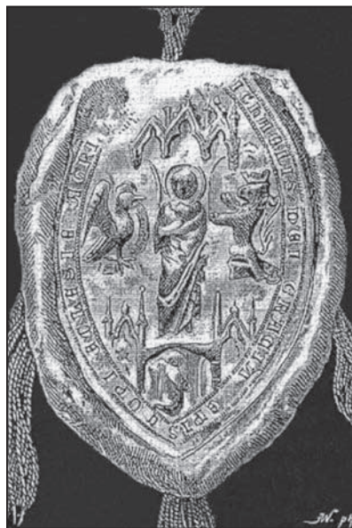
Pečať jagerského biskupa Michala Sečeního (1362 – 1375).