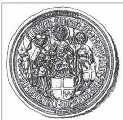
Pečať krakovského biskupa Zbigniewa Olesznického (1423 – 1455).