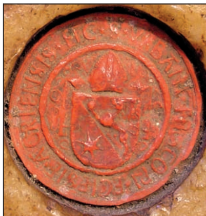
Pečať jágerskeho biskupa Urbana Dóciho (1487 - 1490). Archív R. k. biskupstva v Spišskom Podhradí, 1486

Polovica 15. storočia vniesla do erbov klerikov aj ďalší nový prvok – mitru. 24 Táto liturgická pokrývka hlavy sa v nasledujúcich storočiach stala najrozšírenejšou mimoštitovou súčasťou biskupských erbov. Jej prienik do pečatí a erbov možno sledovať na dvoch pečatiach ostrihomskeho arcibiskupa Hypolita d'Este (1487 – 1497). V pečati z roku 1488 sa nachádza rodový erb arcibiskupa, nad štítom sprevádzaný malým krížikom a prevýšený malou mitrou. V roku 1497 získal tento arcibiskup kardinálsku hodnosť. Práve z tohto obdobia s najväčšou pravdepodobnosťou pochádza jeho druhé pečatidlo. V ňom však už nachádzame okrem erbo-