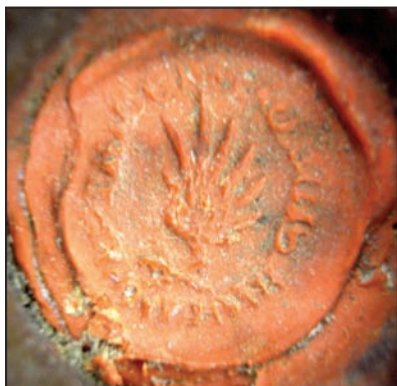
Menšia pečať ostrihomskeho arcibiskupa Jána Kanižaia (1387 – 1418).