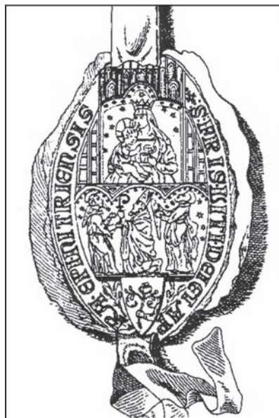
Pečať nitrianskeho biskupa Víta Vašváriho (1334 – 1347?).

vých – na pontifikálnych pečatiach – zachovaných erbov uhorských arcibiskupov sa nachádza na pečati ostrihomskeho arcibiskupa Boleslava z roku 1323. Vľavo dole táto pečať zobrazuje erb Uhorského kráľovstva (v tomto prípade štít posypaný ľaliami) a vpravo erb rodu Piastovcov (orol), z ktorého Boleslav pochádzal. 8