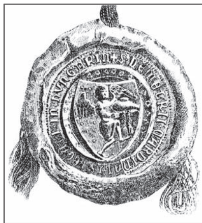
Menšia pečať ostrihomského arcibiskupa a kardinála Demetera Vaškútiho (1378 – 1387). Zdroj: Pór, 1897