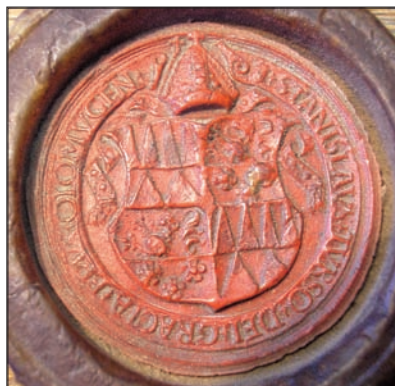
Pečať olomouckého biskupa Stanislava Turza (1496 – 1540). Moravský zemský archív, 1511

cirkevná heraldika (i sfragistika) čerpala zo zahraničných (západoeurópskych) podnetov a tieto postupne, i keď s určitým časovým odstupom, prijímala. Pomerne veľkú flexibilitu možno vidieť v erboch vytvorených v období Kostnického koncilu a po ňom. V tomto období kodifikovaná podoba erbu biskupa (tvoreného štítom a mitrou), arcibiskupa (tvoreného štítom a jednoduchým krížom) a kardinála (tvoreného štítom, krížom a klobúkom) našla veľmi rýchlo uplatnenie takmer v celej Európe. Uhorsko nebolo výnimkou. Možno tiež konštatovať, že aj stvárnenie (arci)biskupskej pečate zodpovedalo plne úzu, ktorý sa presadil v strednej a západnej Európe. Oproti ostatnej Európe v uhorskej cirkevnej heraldike absentovala pred koncom 15. storočia biskupská berla. Napríklad v moravskom prostredí sa s ňou stretávame v pečatiach, v ktorých v erbovej kompozícii nad erbom diecézy bola umiestnená mitra a za štítom s osobným erbom berla. Vo Francúzsku a Nemecku sa v niektorých (najčastejšie sekrétnych) pečatiach vyskytuje medzi dvoma štítmí (erbom diecézy a osobným erbom biskupa). I tu však ide skôr o zriedkavosť. Pravidelne sa s biskupskou berlou stretávame až od 16. storočia, kedy sa natrvalo stala súčasťou erbu biskupa. 44