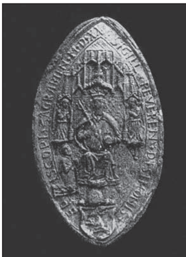
Pečať záhrebského biskupa Šimona Erdődého (1519 – 1543). Zdroj: Bodor, 1984

Zmeny 2. polovice 15. storočia, charakteristické už prechodom na čisto erbovú pečať, kopirovali – ako bolo poukázané pri pečati Urbana