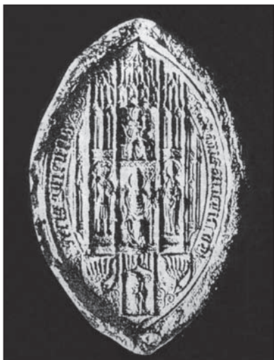
Veľká pečať ostrihomskeho arcibiskupa Jána Kanižaia (1387 – 1418).