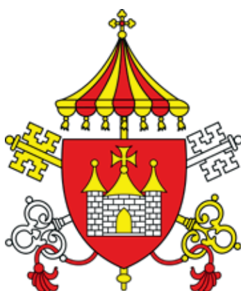
Erb baziliky v Hronskom Beňadiku vychádza z najstaršej pečate kláštora z 13. storočia. Jednoduchý a krásny symbol chrámu dopĺňajú atribúty baziliky – dvojica kľúčov a slnečník.

heraldika objavila o čosi neskôr, začiatkom 14. storočia.“ Práve vďaka cirkevným hodnostárom sa však erby dostali do celého sveta, aj keď „v krajinách tretieho sveta alebo v Oceánii je používanie skutočne kvalitných erbov v menšine.“