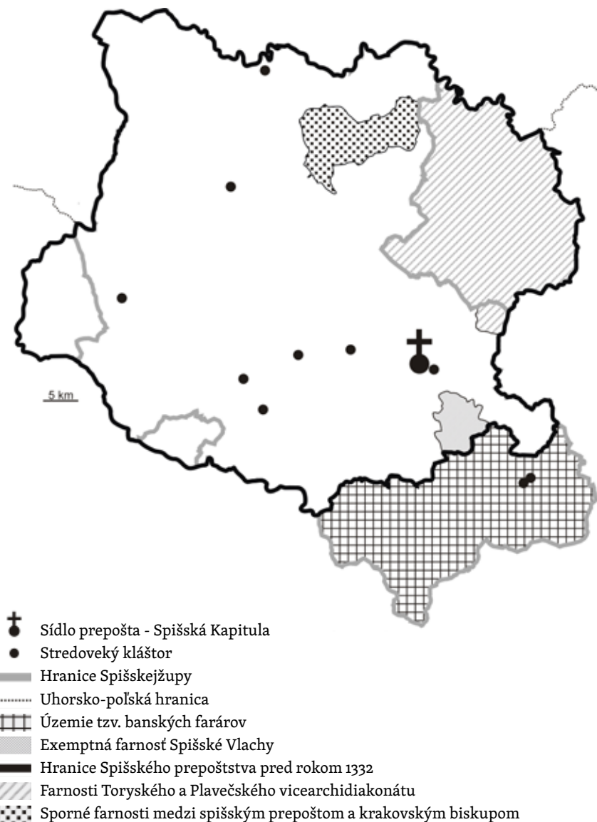
Mapa I. Územie Spišského prepoštstva v stredoveku